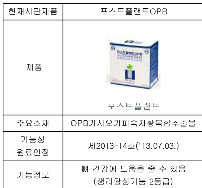
표. 오스코텍 건강기능식품 완제품 및 소재현황

당사는 자체 개발한 개별인정형 소재인 가시오가피숙지황복합물[OPB]을 함유하여 임플란트 고정에 중요한 역할을 하는 『포스트플랜트OPB』 제품을 치과병의원에 공급하고 있습니다.